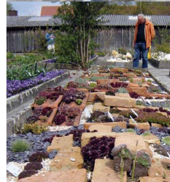
Der Gartengestaltung ist ein Schwerpunkt auf der Landesgartenschau gewidmet