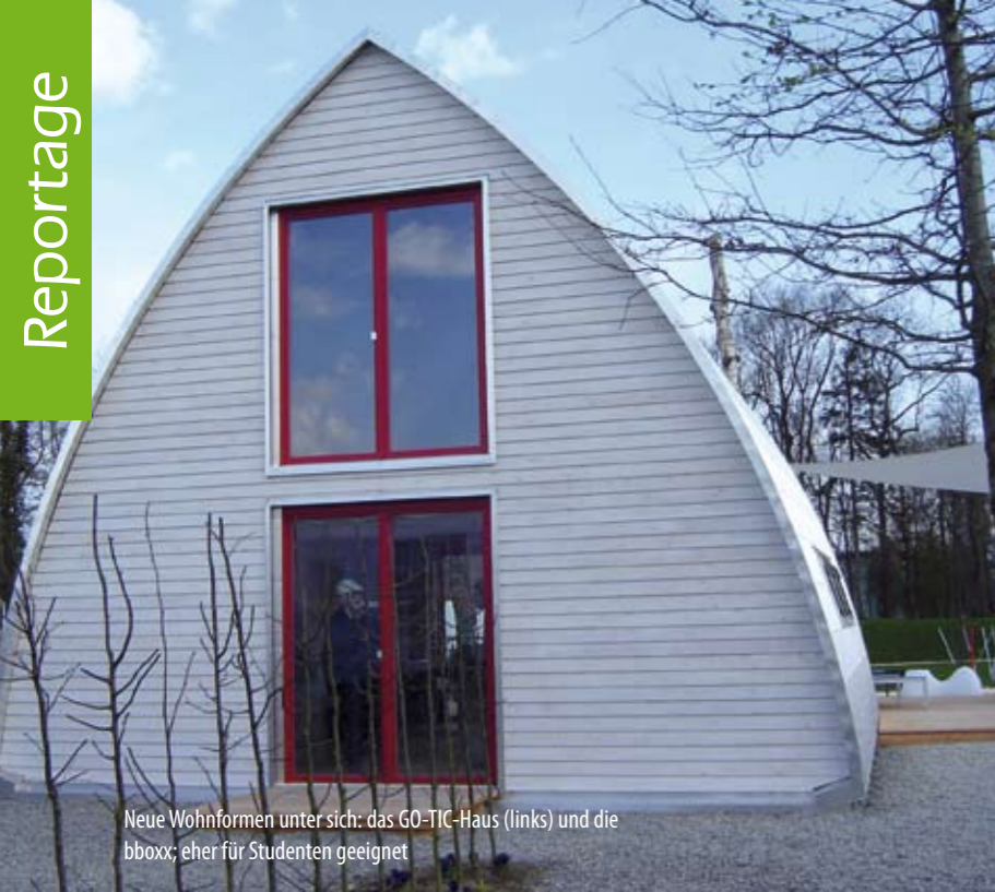
Neue Wohnformen unter sich: das GO-TIC-Haus (links) und die bboxx; eher für Studenten geeignet